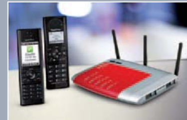
FRITZ!Fon MT-F, FRITZ!Fon MT-D und FRITZ!Box Fon WLAN 7270

Entwicklung. So setzen wir immer wieder Maßstäbe – zum Beispiel beim Thema Funk. Das aktuelle Topmodell unter den FRITZ!Box Produkten integriert das schnelle WLAN N und eine DECT-Basisstation für schnurloses Telefonieren. In Verbindung mit dem DECT-Telefon FRITZ!Fon MT-D lässt sich die Internettelefonie in brillantem und natürlichem HD-Klang wiedergeben.